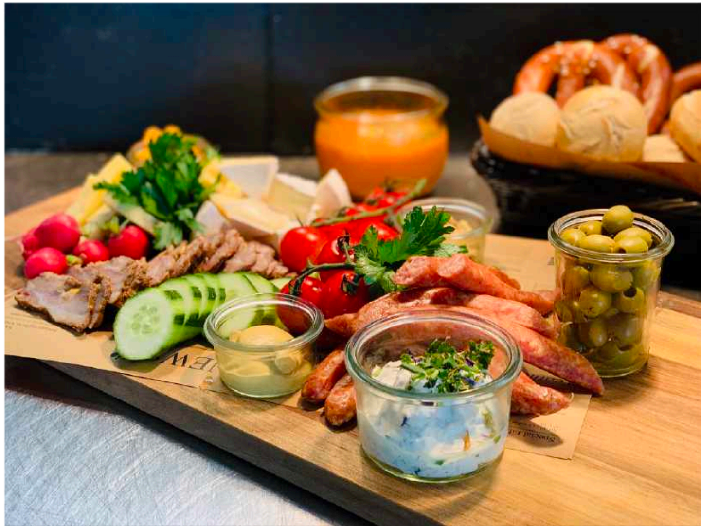
Abbildung für 5 Personen

Dieses Angebot servieren wir drinnen und draußen